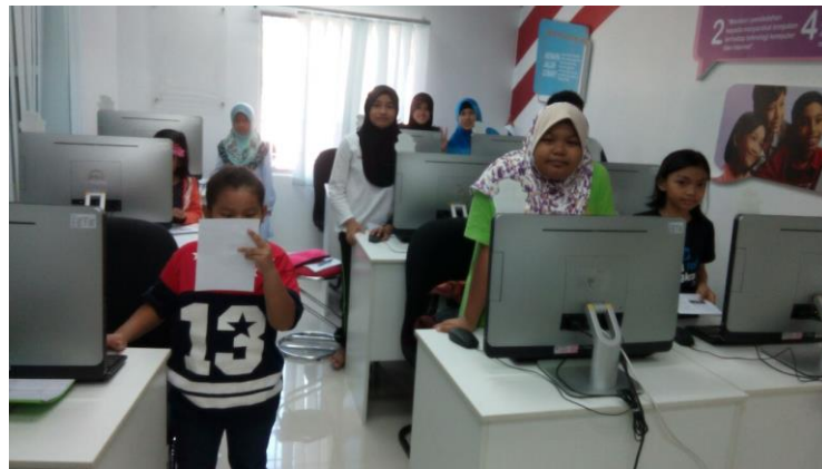
Pelajar sedang mengikuti kelas Penjodoh Bilangan