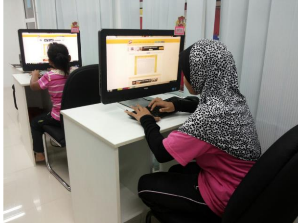
Antara pelajar yang mengikuti kelas menaip dan melakukan Typing Speed Test