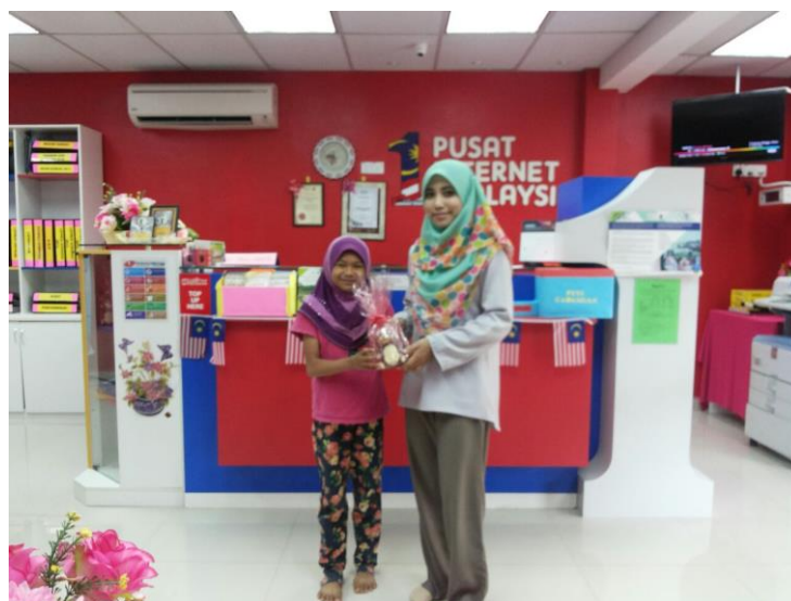
Penyampaian hadiah kepada pelajar yang memenangi Typing Speed Test