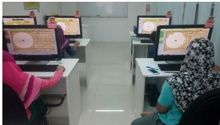
Kelas E-Pembelajaran : Pelajar sedang menyiapkan permainan Puzzle