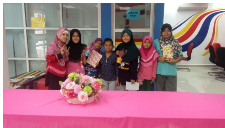
Antara pelajar yang menghadiri kelas Latihan ICT di Pusat Internet 1Malaysia Felda Mempaga 3