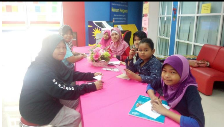
Antara aktiviti sampingan yang dijalankan selepas kelas : Word Search