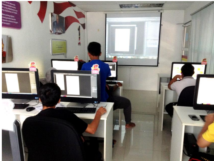
Pelajar menggunakan perisian Adobe Photoshop untuk mengedit imej multimedia untuk menyertai Pertandingan Dakwah Digital KDB