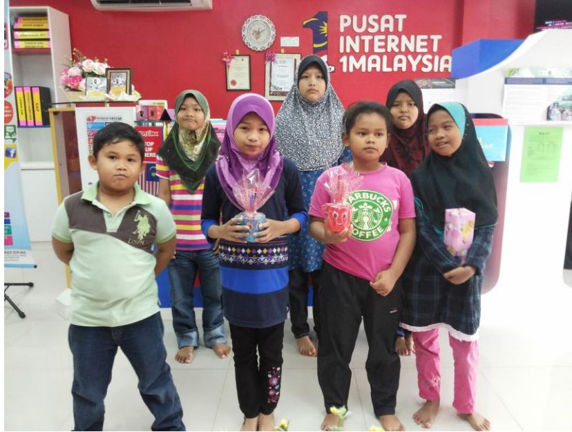
Antara pelajar Sekolah Kebangsaan yang mengikuti Kelas e-Learning di PI1M